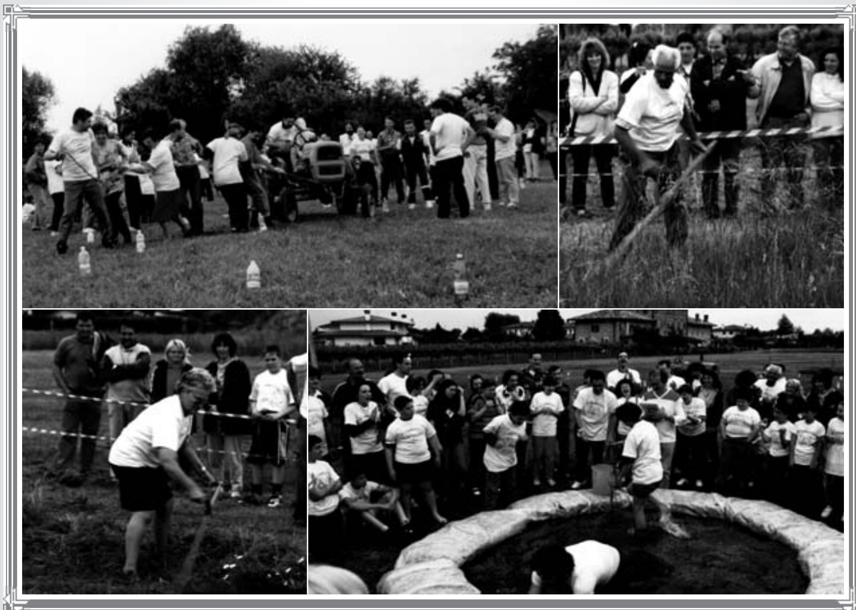
Feste della famiglia