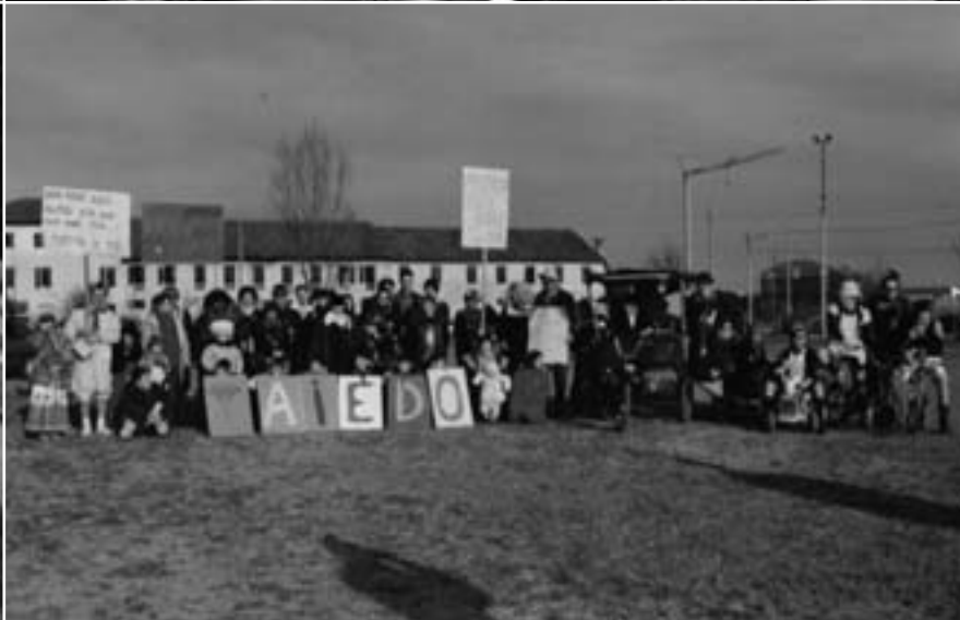
Sfilate di carnevale