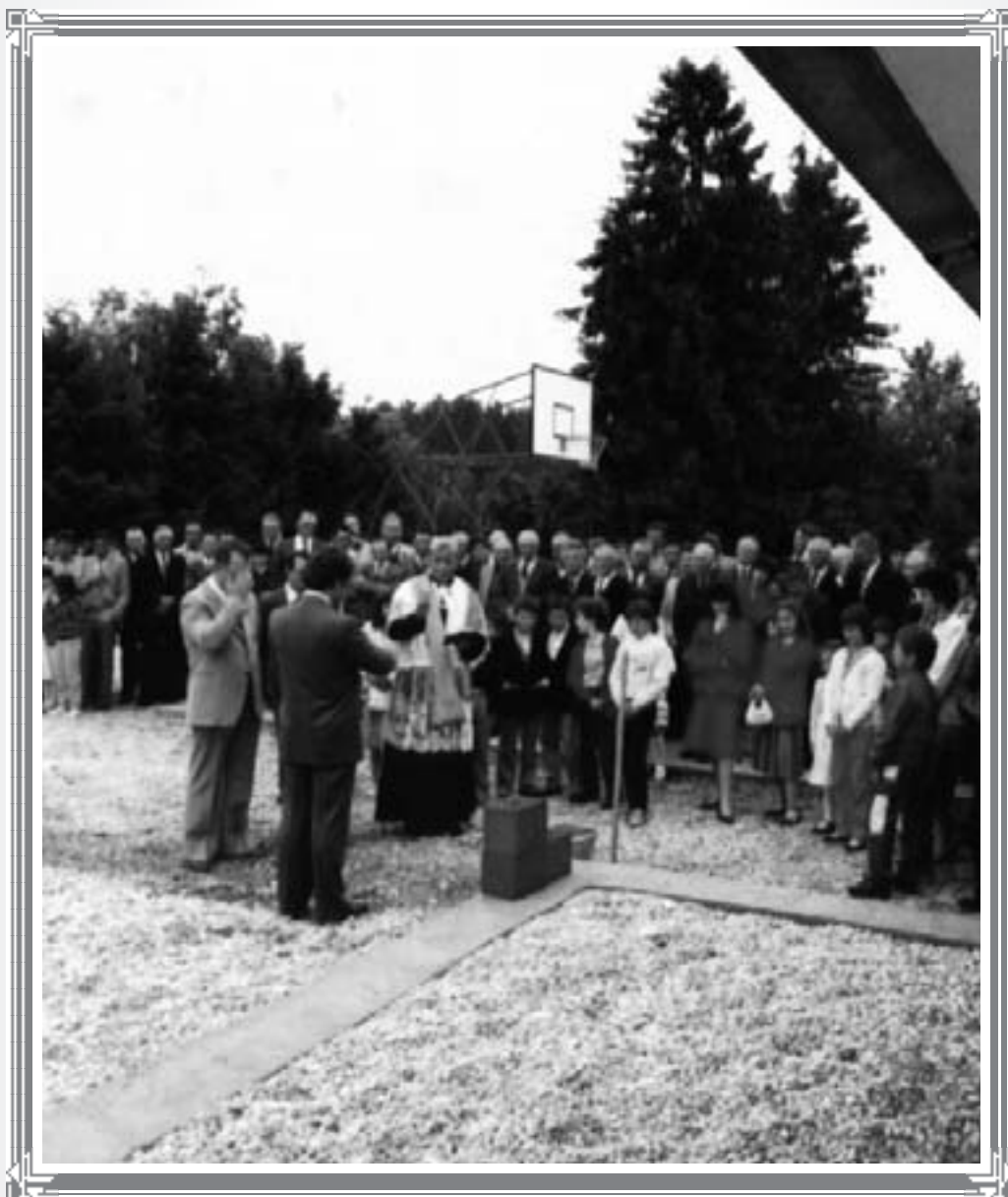
Posa della prima pietra del Centro Sociale (1985)