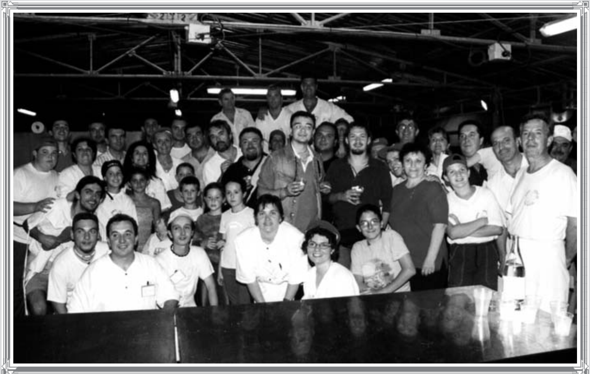
I Nomadi a Taiedo (2002)