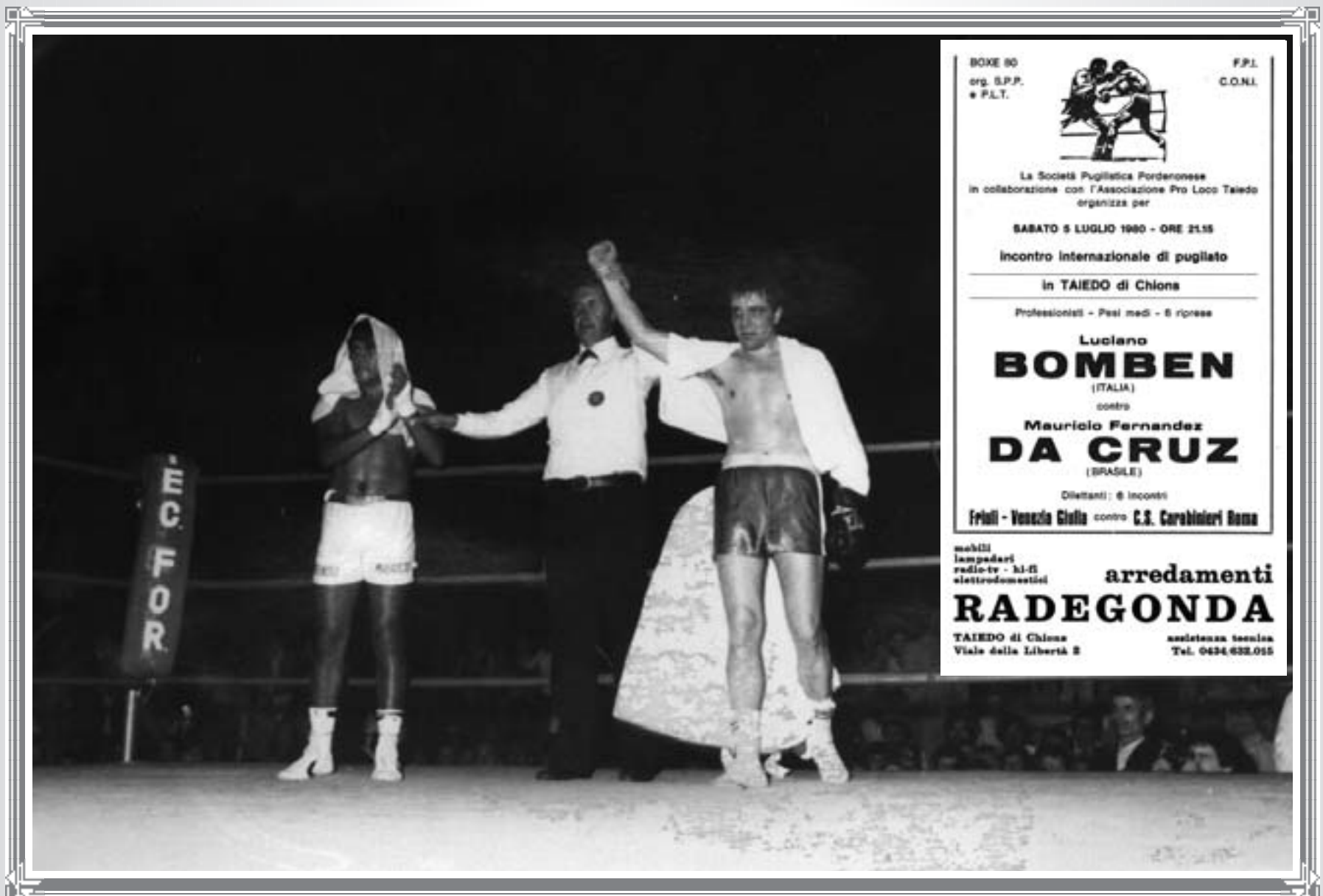
Incontro di boxe internazionale - Prima Sagra (1980)