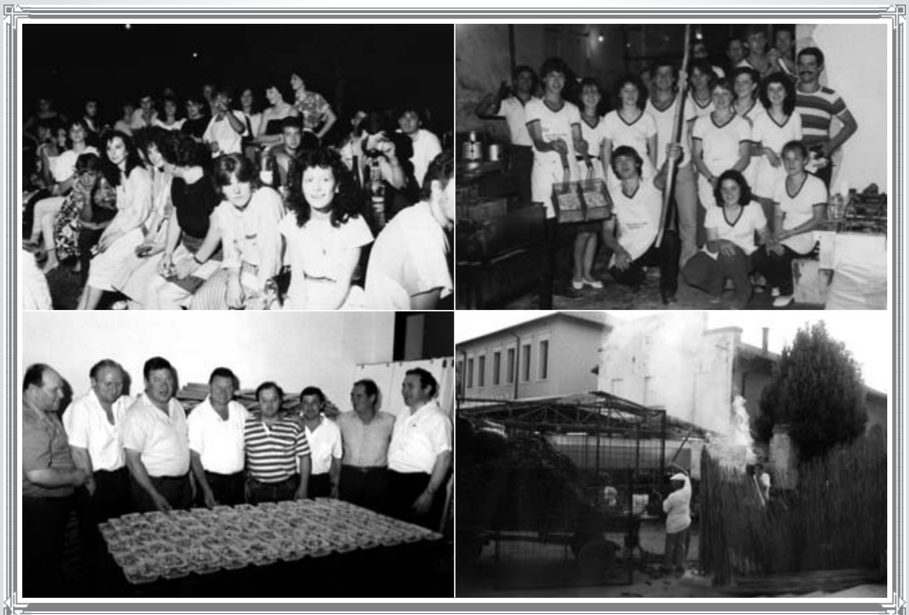
Momenti di sagra